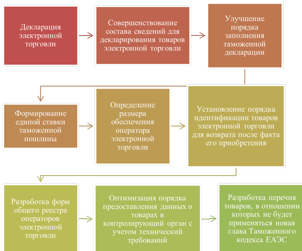
Рис. 4 / Fig. 4. Механизм совершенствования регулирования трансграничной электронной торговли при принятии новых нормативно-правовых актов ЕЭК [9] / The mechanism for improving the regulation of cross-border electronic commerce in the adoption of new regulatory legal acts of the EEC [9]